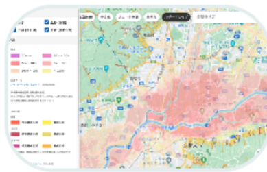
賃貸経営マップで 必要な情報をチェック