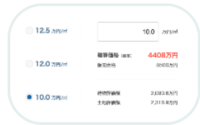
積算価格を自動計算する シミュレーション機能